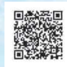
Application IOS Weatherlink 6556