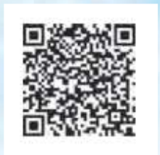
Application Android WeatherLink 6557