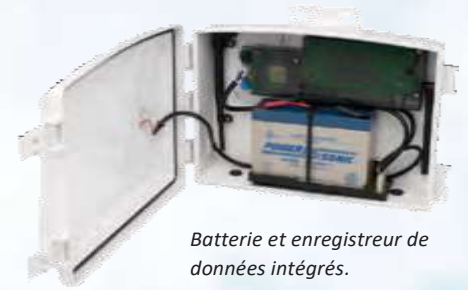
Batterie et enregistreur de données intégrés.

Disponible dans les versions sans fil et câblée, Vantage Connect peut prendre la place de votre console ou la compléter pour envoyer des données météorologiques directement au «Cloud» à l'aide du réseau mobile. La version sans fil de Vantage Connect est radio-compatible avec les émetteurs et les répéteurs Vantage Pro2 et Vantage Vue pour une intégration facile.